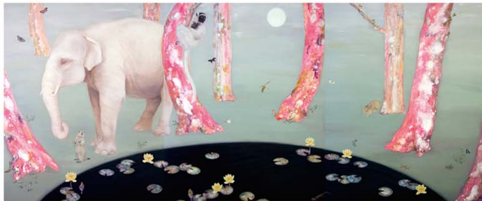
月とプール 162.0×390.9cm (F100×3枚) キャンバスにアクリル、油彩、刺繡 2009